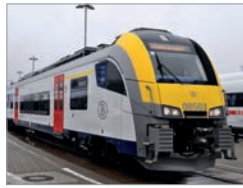
Desiro ML AM08 Belgien