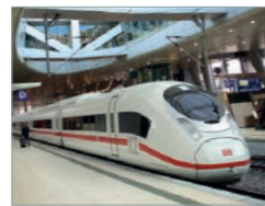
Velaro D Deutschland