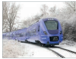
Coradia Nordic X60 Schweden