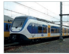
Sprinter Lighttrain SLT Niederlande