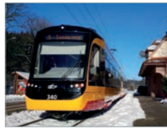
NET 2012 Deutschland