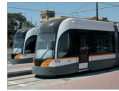
Flexity, Valencia & Alicante Spanien