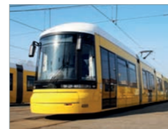
Flexity, Berlin Deutschland