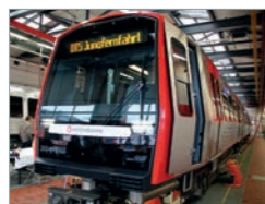
DT5, Hamburg Deutschland