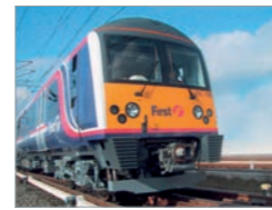
Desiro UK Class 360 Deutschland