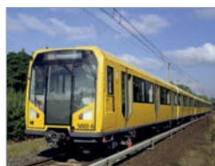
H01, Berlin U-Bahn Deutschland