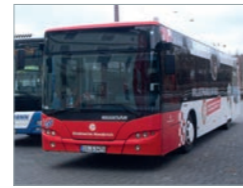
Neoplan Centroliner Bus Deutschland