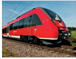
Talent 2 Deutschland