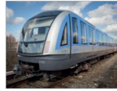
MVG C2, München U-Bahn Deutschland