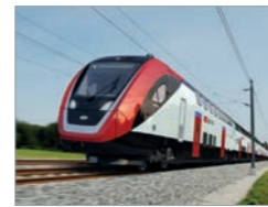
Twindex Swiss Express Deutschland