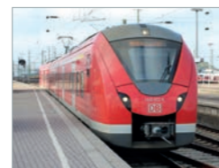
Coradia Continental Deutschland