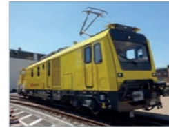
HARSCO EHFZ, SBB Deutschland