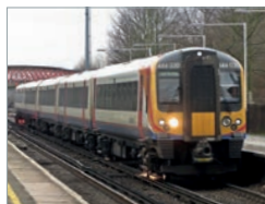
Desiro UK Class 444 Deutschland