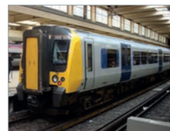
Desiro UK Class 350 Deutschland