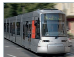
NF8U, Rheinbahn Düsseldorf Deutschland