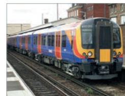
Desiro UK Class 450 Deutschland