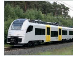
Desiro ML, MRB Deutschland