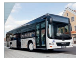
Man Lion's City Bus Deutschland

EINFACH ANKOMMEN. Weil alles verlässlich funktioniert.